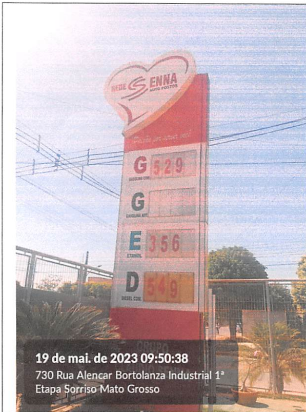
19 de mai. de 2023 09:50:38 730 Rua Alencar Bortolanza Industrial 1ª Etapa Sorriso Mato Grosso

Ministério da Justiça Sistema Nacional de Defesa do Consumidor Diretoria Executiva - PROCON Município de Sorriso-MT POSTO SENNA