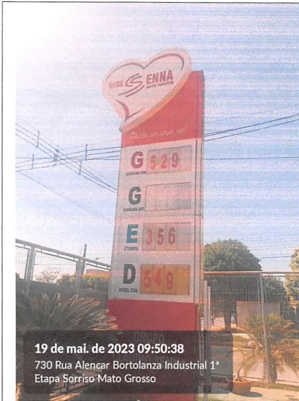
19 de mai. de 2023 09:50:38 730 Rua Alencar Bortolanza Industrial 1ª Etapa Sorriso Mato Grosso