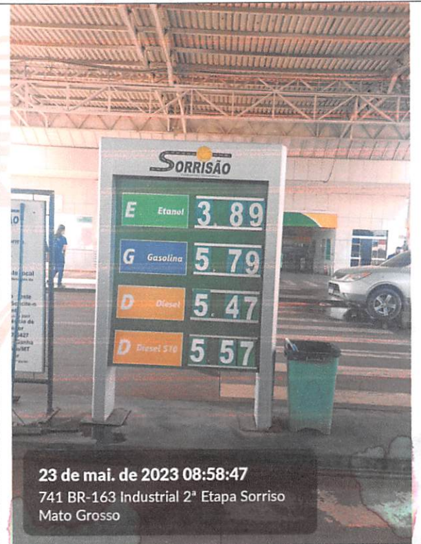
23 de mai. de 2023 08:58:47 741 BR-163 Industrial 2ª Etapa Sorriso Mato Grosso