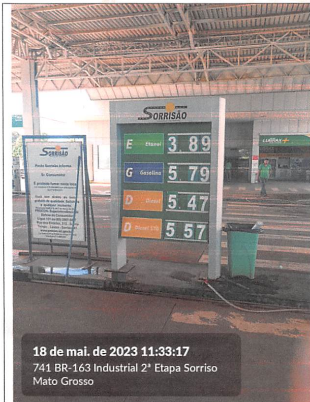
18 de mai. de 2023 11:33:17 741 BR-163 Industrial 2ª Etapa Sorriso Mato Grosso