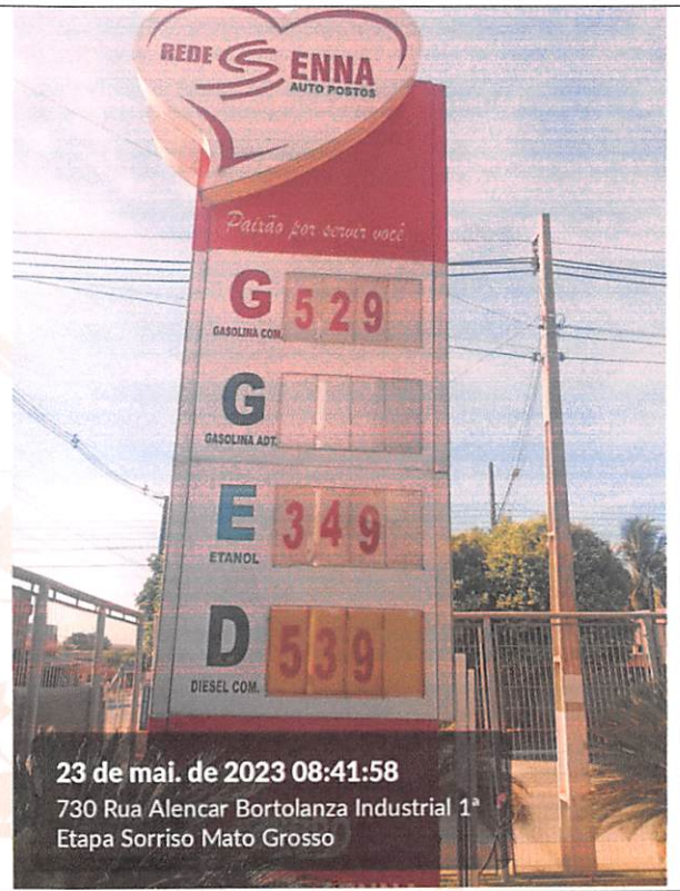
23 de mai. de 2023 08:41:58 730 Rua Alencar Bortolanza Industrial 1ª Etapa Sorriso Mato Grosso