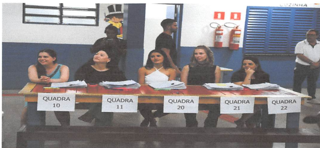
Cerimônia de entrega de Títulos Nova Aliança II

Na oportunidade, informamos que no dia 11 de dezembro de 2023, na Escola Municipal Francisco Donizeti de Lima, foi realizada a entrega de 67 contratos com valor de escritura a moradores do Residencial Nova Aliança II, sendo que ao todo, 100 contratos foram levados para serem entregues, no entanto, 33 ainda aguardam a retirada, na sede da Secretaria da Cidade, no Park Shopping Sorriso, de segunda a sexta-feira, das 7h às 11h e das 13h às 17h.