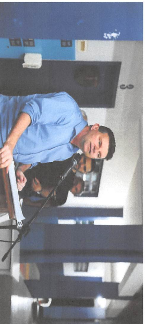
Prefeito Municipal Ari Genézio Lafin