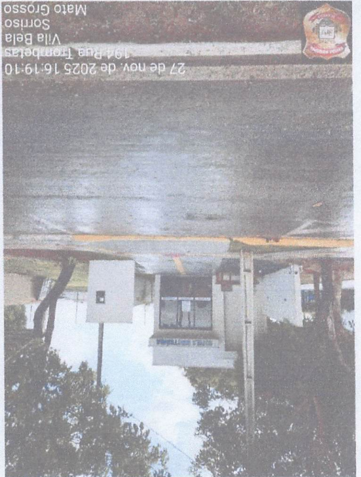
27 de nov. de 2025 16:19:10 194 Rua Trombetas Vila Bela Sorriso Mato Grosso