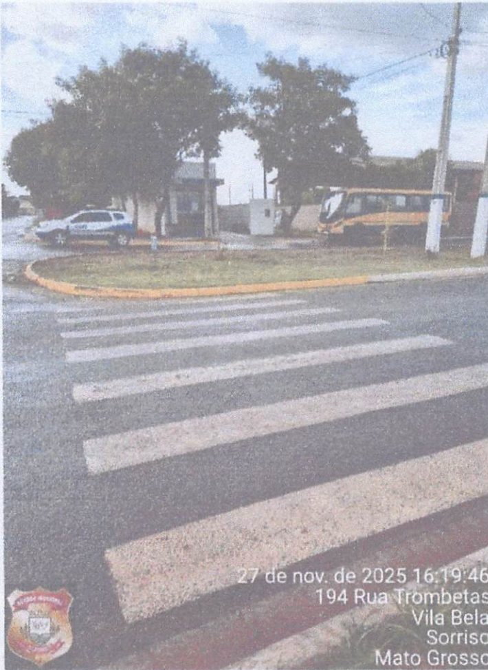
27 de nov. de 2025 16:19:46 194 Rua Trombetas Vila Bela Sorriso Mato Grosso