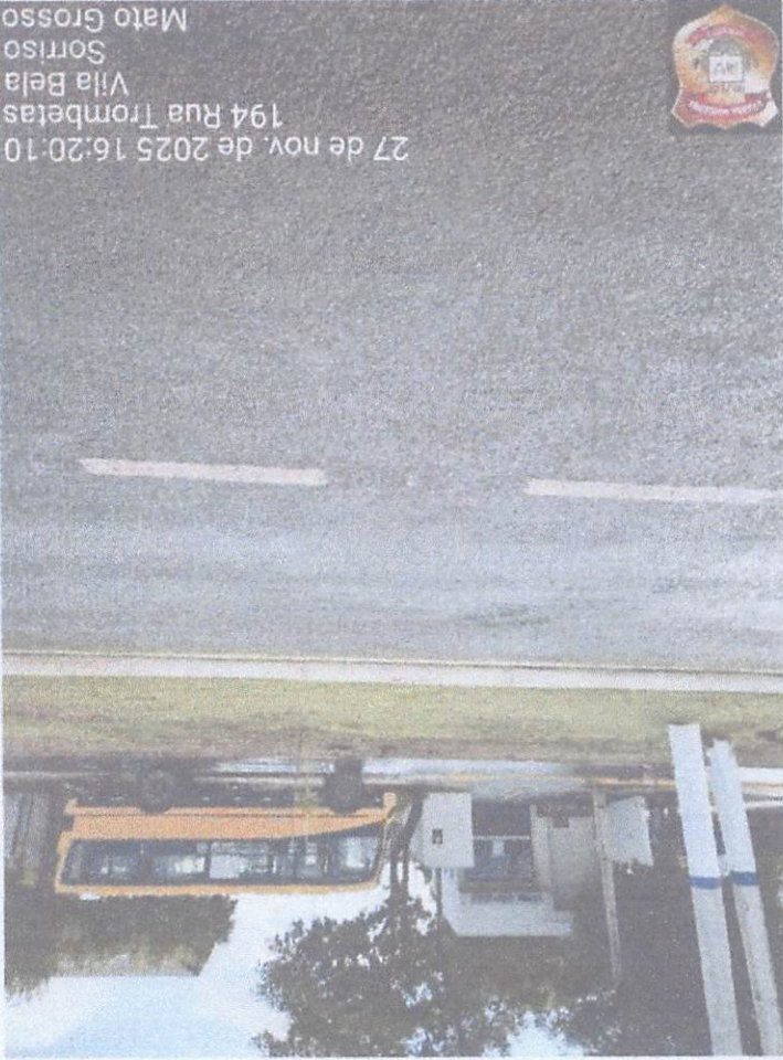
27 de nov. de 2025 16:20:10 194 Rua Trombetas Vila Bela Sorriso Mato Grosso