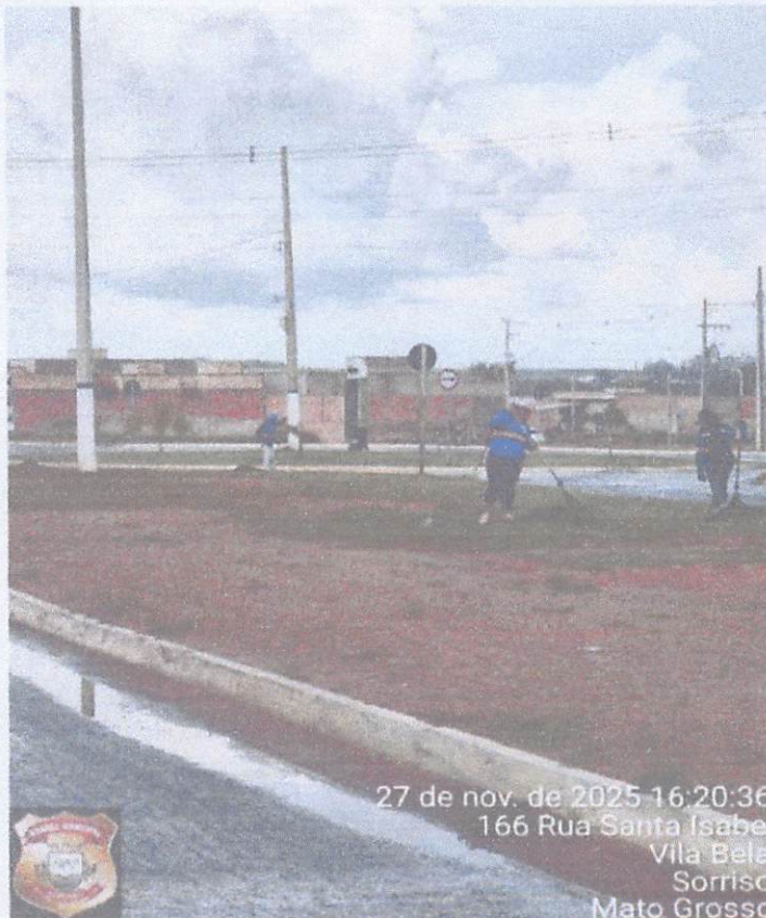
27 de nov. de 2025 16:20:36 166 Rua Santa Isabel Vila Bela Sorriso Mato Grosso