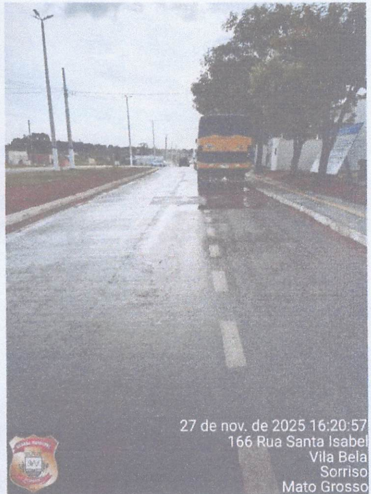
27 de nov. de 2025 16:20:57 166 Rua Santa Isabel Vila Bela Sorriso Mato Grosso