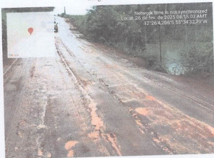
Imagem - 02

PREFEITURA MUNICIPAL DE SORRISO SEMOSP - SECRETARIA MUNICIPAL DE OBRAS E SERVIÇOS PÚBLICOS Rua São João nº 2294, Bairro Industrial, MT, CxP: 78895-079 Telefone: (66) 3545-8381 | E-mail: semosp@sorriso.mt.gov.br - www.sorriso.mt.gov.br