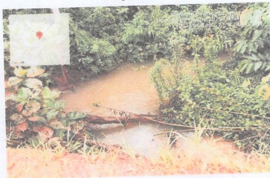
Imagem - 04