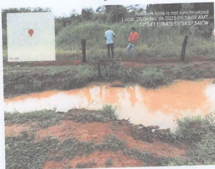
Imagem - 04

PREFEITURA MUNICIPAL DE SORRISO SEMOSP - SECRETARIA MUNICIPAL DE OBRAS E SERVIÇOS PÚBLICOS Rua São José n° 2094, Bairro Industrial - MT, Cep: 79800-079 Telefone: (66) 3545-8345 | E-mail: semosp@sorriso.mt.gov.br - www.sorriso.mt.gov.br