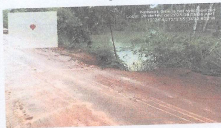
Imagem - 01