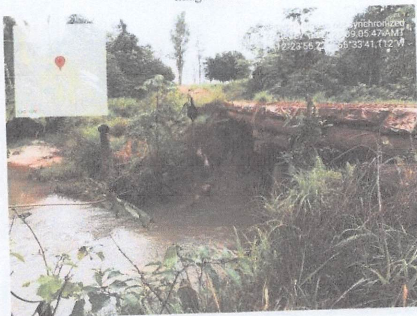
Imagem - 03