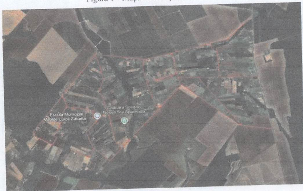
Figura 1 – Mapa de situação I

PREFEITURA MUNICIPAL DE SORRISO SEMOSP - SECRETARIA MUNICIPAL DE OBRAS E SERVIÇOS PÚBLICOS Rua São José nº 2094, Bairro Industrial - MT, Cep: 78855-019 Telefone: (64) 3545-8385 | E-mail: semosp@sorriso.mt.gov.br - www.sorriso.mt.gov.br