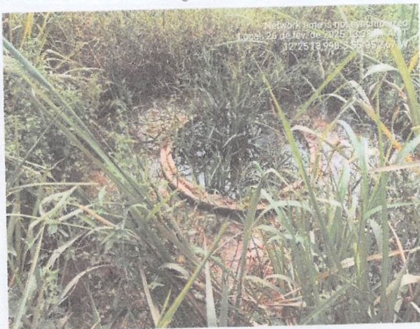
Imagem - 04